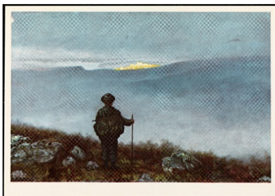
Theodor Kittelsen: Soria Moria slott

Askerskolen har utarbeidet felles standarder for et trygt og godt læringsmiljø med mål og tiltak for elever, ansatte, ledelse og skoleeier. Elever har deltatt i dette arbeidet. På midten av 1990 tallet ble det vedtatt en felles visjon for Asker som lød: « Alle barn i Askers barnehager og skoler skal regelmessig oppleve gleden av å lykkes med noe ».