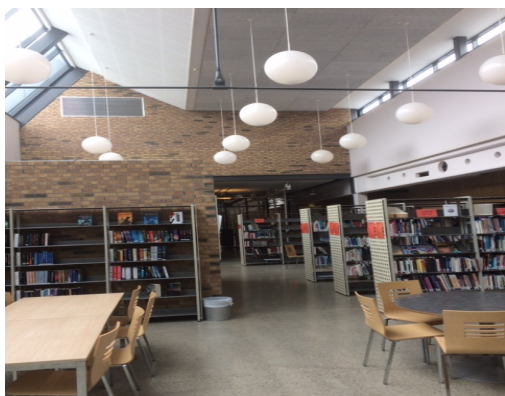
Borgen skoles bibliotek

budtjenesten eller besøk på senteret. Asker styrket skolebiblioteket som ressurs med egen veileder sentralt og egne bibliotekarer på hver skole.