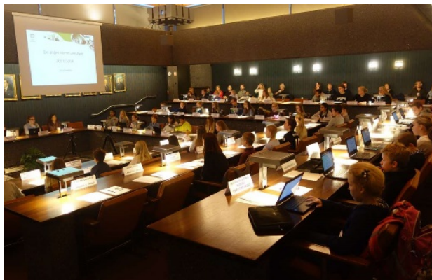
Beslutningsmøte i DUK.

De Unges Kommunestyre (DUK) ble etablert i 1998. Representanter fra alle skolene, i alt 47 representanter, møter i Asker rådhus 2 ganger årlig. Allerede fra det første året fikk DUK eget budsjett, og vedtakene i de unges kommunestyre ble fulgt opp og iverksatt i henhold til dette. Målet er å sikre de unges innflytelse og gi demokratiopplæring. Budsjettet er i 2018 på 300 000 kroner, og behandling og avstemming foregår som i det virkelige kommunestyret. DUK har vedtatt flere planer mot mobbing, og en rekke trivsels- og aktivitetsfremmende tiltak rundt i kommunen.