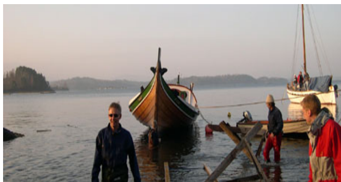
God Bør sjøsettes

Vektleggingen av et skoleløp for alle i en felles enhetsskole hadde som utilsiktet konsekvens at noen ikke lyktes. Det var elever som av meget sammensatte årsaker ikke fant seg til rette i sammenholdte klasser i den nokså teoretiske