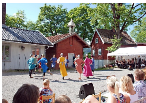
Askerspillet på Østre Asker gård

Da staten åpnet opp for at man også kunne få statsstøtte for å undervise i andre kulturfag enn musikk, var Asker raskt ute med å tilby undervisning i breakdance, afrikanske trommer og tegning og maling. Dette skjedde rundt 1997, og skolen byttet da navn til Asker kommunale musikk- og kulturskole og senere til Asker kulturskole .