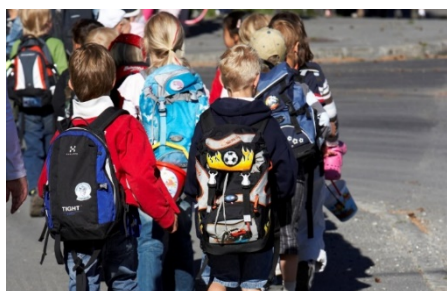
Seksåringer på skolevei

Hele forberedelsestiden fram mot Reform 97 og forsøk med pedagogisk tilbud til seksåringer (1986-90) dreide seg om politiske og pedagogiske spørsmål knyttet til seksåringer og skolestart. Allerede fra 1970 tallet hadde flere Askerskoler et førskoletilbud til seksåringer tilknyttet skolen (korttidsbarnehage). Blant disse var Rønningen skole med førskoletilbud fra 1977. Men de fleste foreldrene valgte å ha barna i barnehage frem til skolestart.