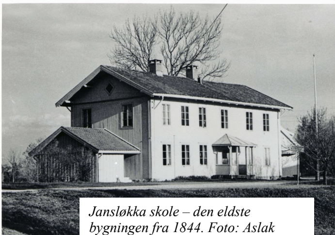
Jansløkka skole – den eldste bygningen fra 1844. Foto: Aslak Aarhus (1975)

Sognepresten forsøkte å få lagt skolen til Biterud som også var en del av prestegårdsgrunn. Han argumenterte for at Biterud lå mer i midten av sognet, og at trafikken på kongeveien kunne være farlig for barna.