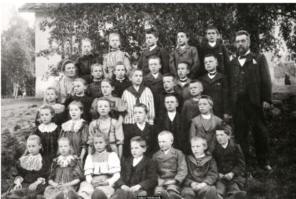
Fra Drengsrud skole i 1898

Vi må også nevne at fabrikker med over 30 arbeidere hadde plikt til å drive egen skole. Heggedal Tændstikfabrik fikk sin egen fastskole i 1885. Barna jobbet i tillegg på fabrikken. Fabrikkleidelsen prioriterte ikke skole særlig høyt, og den fikk et dårlig rykte. Da fabrikken brant ned i 1896, ble skolen umiddelbart lagt ned. I 1897 ble Heggedal en egen skolekrets med undervisning på Heggedal gård. I 1905 kunne elever i Heggedal flytte inn i sin nye skole på Gjellum. Elevtallet steg raskt, og det ble snart behov for å bygge på eller bygge nye skoler. Jansløkka fikk ny skolebygning i 1915, Solberg i 1917 og Vettre i 1918. Holmen fikk ny bygning i 1932, og på Drengsrud var de meget misfornøyde med bare å få flyttet over den gamle skolen på Holmen det samme året.