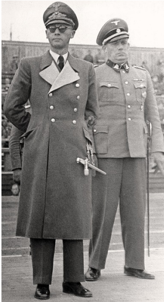
Terboven og Rediess som begge tok sitt eget liv på Skaugum

I september 1943 ble imidlertid alle skolebygningene i Asker beslaglagt av tyskerne. Jansløkka ble innkvartering for tyske SS-soldater som skulle forsterke vaktholdet på Skaugum der Terboven bodde. Holmen skole ble innredet til et trykkeri, mens de øvrige skolene fikk fortsette inntil videre. Et år etter ble Drengsrud skole stengt og ble kaserne for tyske tropper. Men undervisningen fortsatte i private hjem på alle de okkuperte skolene.